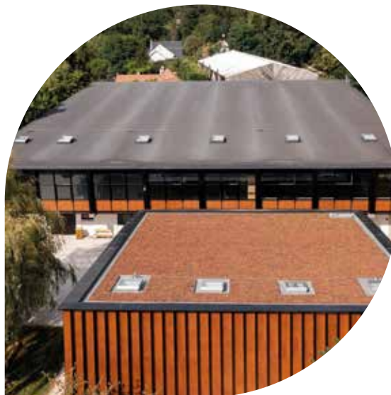
Hôtel Novotel - Paris Vaugirard Réaménagement et réfection d'une toiture terrasse technique autoprotégée